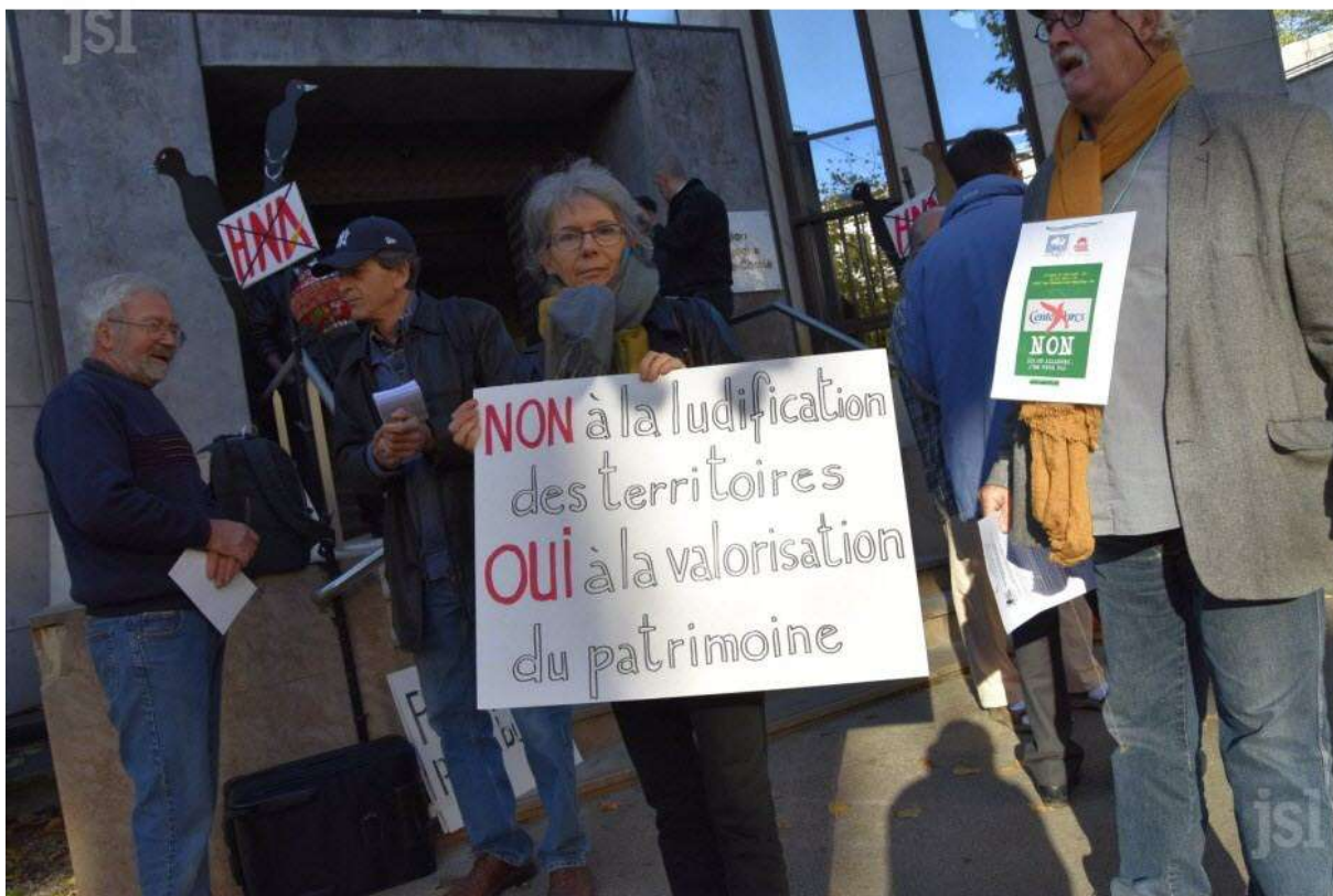
Manifestation des antis Center Parcs devant le Conseil régional à Dijon