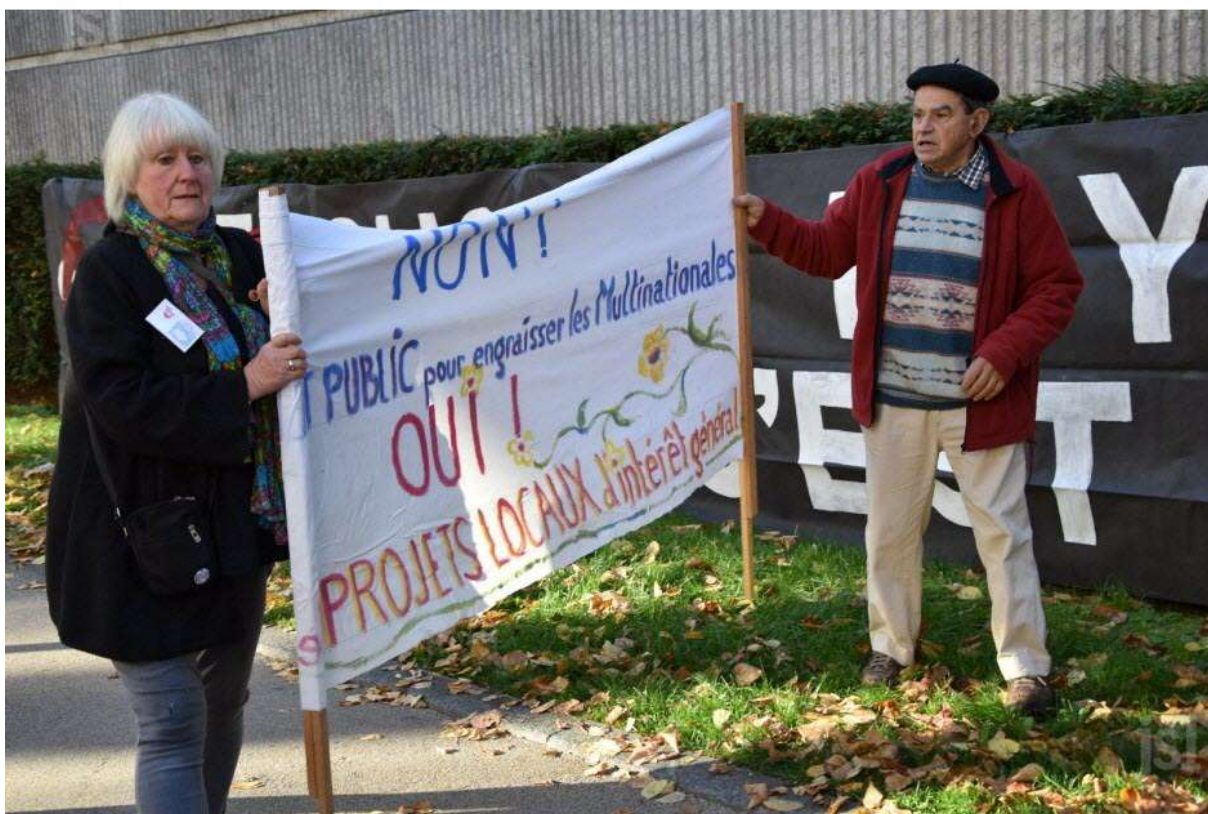
Manifestation des antis Center Parcs devant le Conseil régional à Dijon