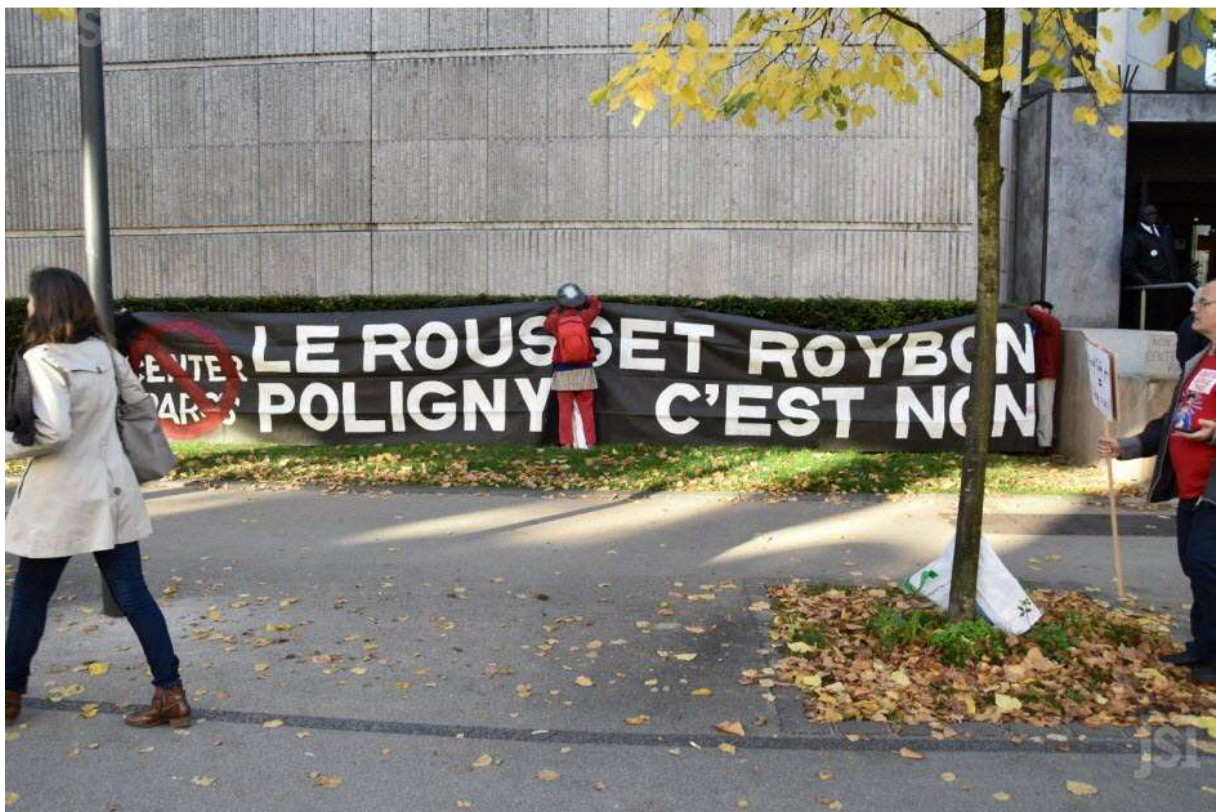
Manifestation des antis Center Parcs devant le Conseil régional à Dijon