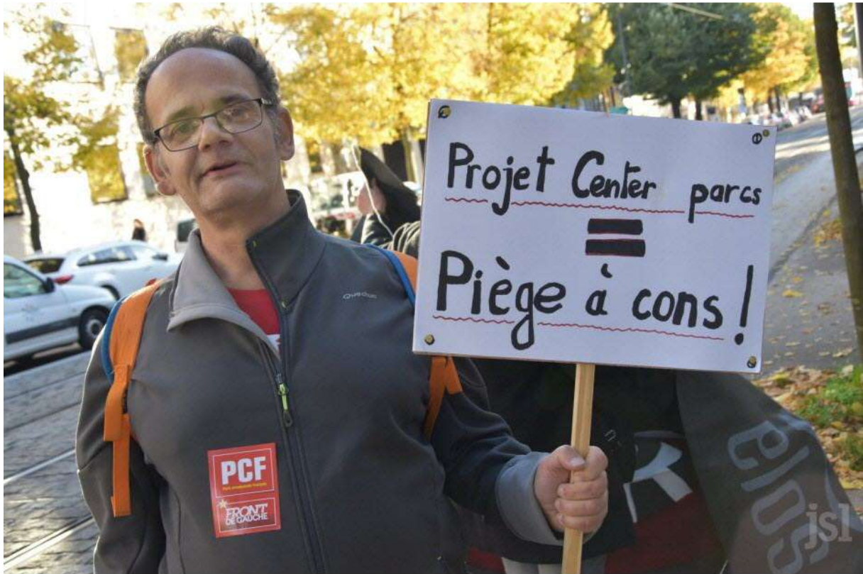
Manifestation des antis Center Parcs devant le Conseil régional à Dijon